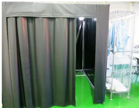
暗室タイプのクリーンブースを用いて視認性を向上